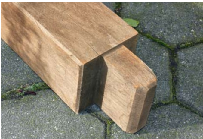
Tropenholzer: Bangkirai (oben), Bilinga (Mitte), Bilinga verwittert (unten)

Gefälleausbildung der Oberfläche in Richtung der Holzriffelung.