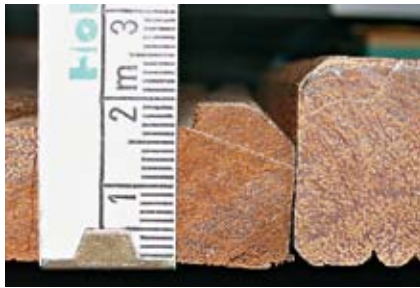
Dielen unter 20 mm (links) sind für ein fachgerechtes Bauwerk nicht geeignet

Holzdecks: Konstruktiver Holzschutz ist das A und O, damit Terrassen halten