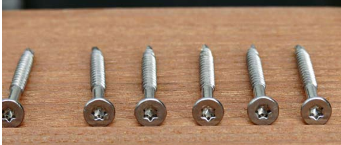
Edelstahlschrauben sind für Decks aus Tropenholz anzuraten

Was tun gegen Risse und Verfärbungen: dega1783