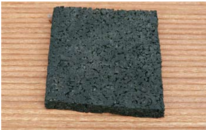
Eine Gummischrotbautenschutzmatte wird als Gleitebene zwischen Punktfundament und Balken verlegt

Holz kommt und aufgrund der im Holz enthaltenen Säure (besonders Gerbsäure in Eichenholz) der Rostschutz nur von kurzer Dauer ist.