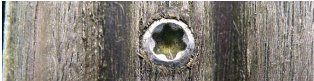
Die Schraubenköpfe sollten bündig mit der Holzoberfläche abschließen