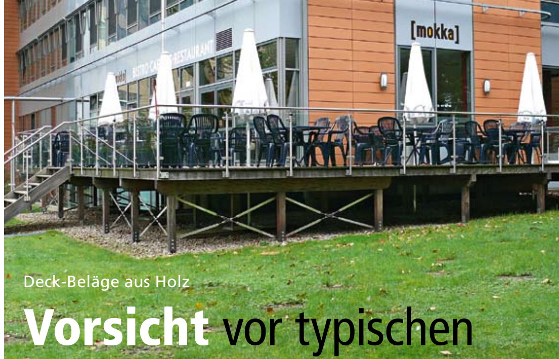
Deck-Beläge aus Holz