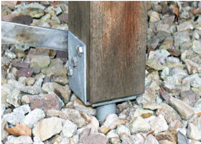
Punktauflager (oben) und Pfostenschuhe (unten) schützen das Holz vor Bodenfeuchtigkeit und Staunässe