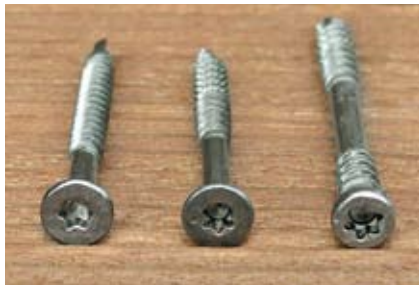
Spezialschrauben aus Edelstahl sollen den Halt garantieren