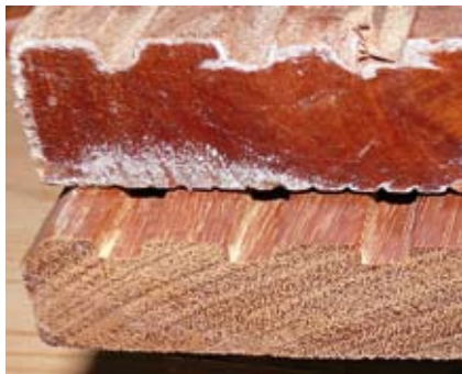
Das Versiegelungswachs an den Brettenden muss beim Einbau entfernt werden