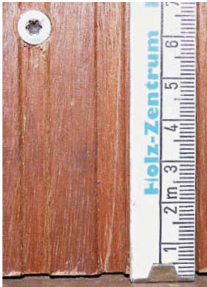
Bei einer Stärke von 2,5 cm sollte der Abstand zum Brettende 6,25 cm betragen