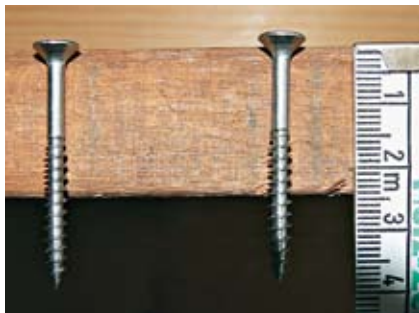
So nicht: Bei dieser Dielenstärke ist der Schraubenquerschnitt zu gering