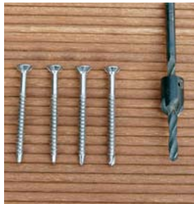
Edelstahlschrauben und Spezialsenkbohrer sind für Tropenholz sinnvoll