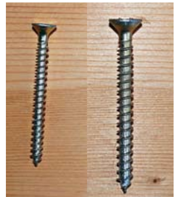
So nicht: Schrauben mit Gewinde bis zum Kopf sind ungeeignet

windungen überhaupt verwendet werden können.