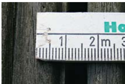
Zu schmal darf die Fuge nicht sein (oben), 6 bis 10 mm sind erforderlich (unten)